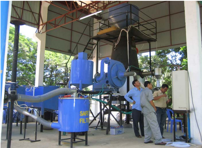
ឡឥន្ធនៈ ដោយដុតអង្កាមនៅរោងម៉ាស៊ីនកិនស្រូវ សុង ហេង

ក្រុមហ៊ុន អេសអិមអ៊ី វិញ្ញាណប័ណ្ណ អេនឺជី លីមីតធីត ផ្តល់នូវ ដំណោះស្រាយដល់សហគ្រាសរបស់លោក អ្នកអោយអាចសន្សំ ប្រេងនិងបង្កើន ការផ្គត់ផ្គង់ថាមពល ដល់សហគ្រាសរបស់លោក អ្នក ។ ដំណោះស្រាយមួយ គឺការប្រើឡឥន្ធនៈដែលអាច ដុតបម្លែង ជីវម៉ាស ដូចជា អង្កាម អុស ស្លូលពោត សំបក សណ្តែកដី សំបកស្វាយចន្ទី អោយទៅជាប្លាស ដែលអាច បញ្ជោះបាន ។ ប្លាសនេះអាចប្រើជំនួស ប្រេង ឥន្ធនៈបានរហូត ដល់ 60-70ភាគរយ ។ ជាមួយនឹងតម្លៃប្រេងបច្ចុប្បន្ន ការប្រើ ឡឥន្ធនៈដើម្បីប្រើជំនួសប្រេងឥន្ធនៈ នឹងអាចជួយលោក អ្នក អោយអាចសន្សំប្រាក់បានច្រើន ។